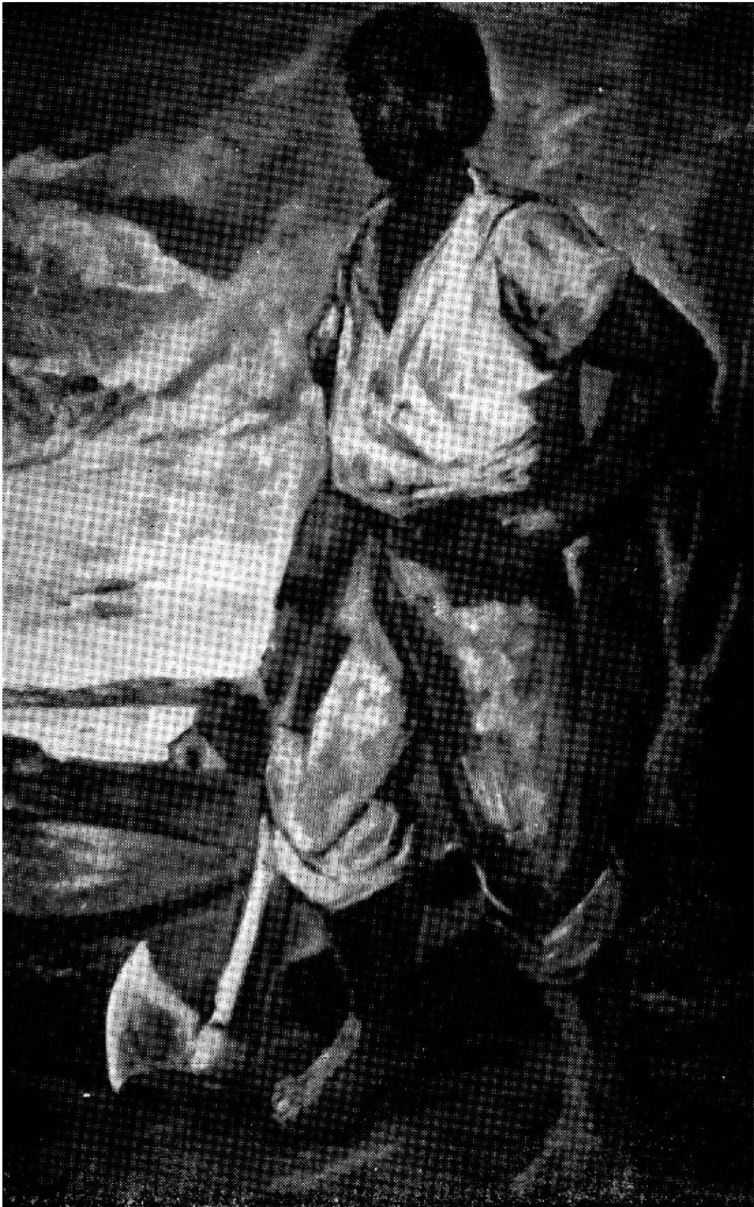
" El Hachero " , óleo de Lucas Brãulio Areco