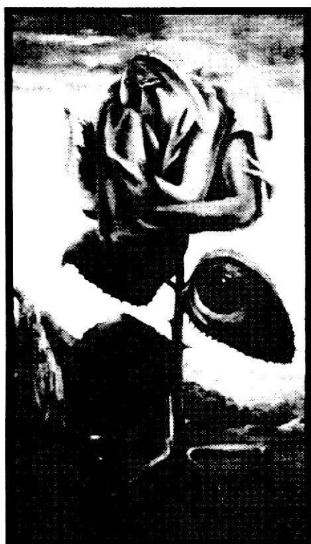
Pintura de Gerónimo Rodríguez