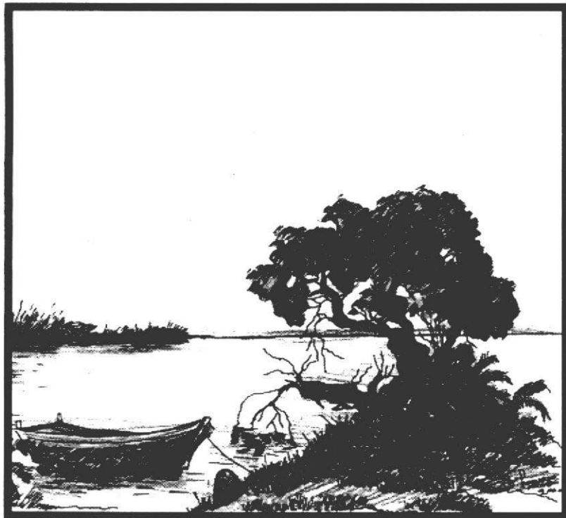
Dibujo de Mandobé Pedrozo