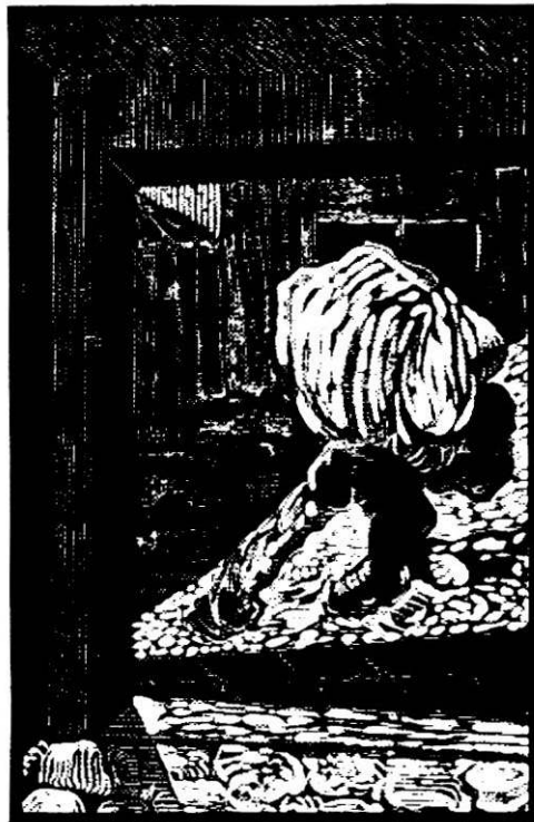
Grabado de Héctor Martinoli