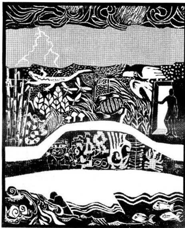
Grabado de Mirian Krause