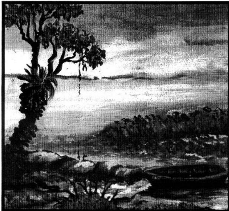
Pintura de Jorge Ezealada